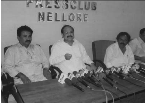
నెల్లూరు ప్రెస్ క్లబ్ లో ఏపీయూడబ్ల్యూజే ఏర్పాటుచేసిన మీట్ ది ప్రెస్ కార్యక్రమంలో మాట్లాడిన బీజేపీ సీనియర్ నాయకుడు వెంకయ్యనాయుడు.

ప్రజాస్వామ్యంలో మీడియా, న్యాయవ్యవస్థ సరిగా పనిచేస్తేనే వ్యవస్థలో లోపాలుండవని బీజేపీ సీనియర్ నాయకుడు ఎం. వెంకయ్యనాయుడు అన్నారు. నెల్లూరు ప్రెస్ క్లబ్ లో