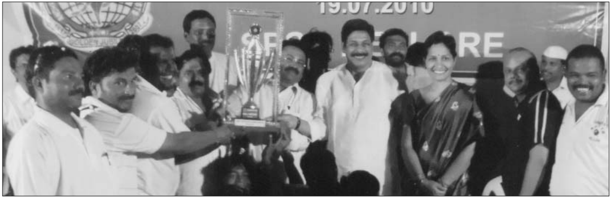
విజేతలకు రోలింగ్ కప్ అందజేసిన నెల్లూరు రూరల్ ఎమ్మెల్యే ఆనం వివేకానందరెడ్డి.